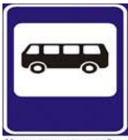
Место остановки автобуса